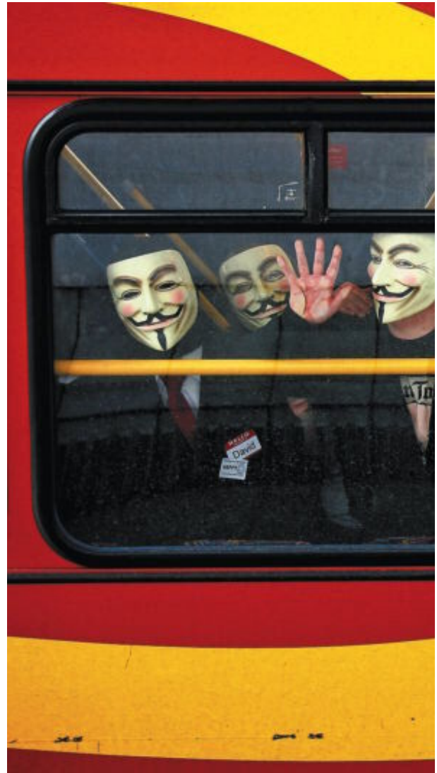
Manifestantes de Anonymous protestan contra la Iglesia de la Cienciología en Londres en 2008.

abogado que representó a Weblogs en el proceso contra los que atacaron su web, asegura en su blog que, aunque interrumpir el funcionamiento de un sistema informático no sea delito ahora, "no quiere decir que no sea un ilícito civil, y por encima de todo, un gravísimo error ético, mediático, político y estratégico". "Tirar abajo las webs de la SGAE o del Ministerio de Cultura no es una hazaña: es una cobardía y una estupidez. Durante mucho tiempo, una lenta y tenaz labor de debate y combate —jurídico, político e ideológico— ha conseguido desgastar la imagen pública de la SGAE. Y de golpe y precisamente en el momento en que se debate en el Parlamento, se les ofrece un inesperado balón de oxígeno: la posibilidad de aparecer como víctimas ante la clase política y la opinión pública".