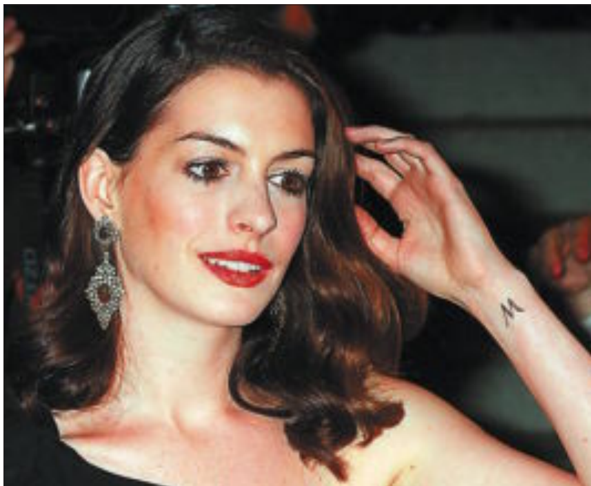
La actriz Anne Hathaway, en Nueva York.

La actriz, de 27 años, se confiesa ahora a Vogue y asegura que su problema es que se ha fiado demasiado de lo que le decían los hombres, pero que “ahora” se ha vuelto más precavida. Antes del asunto Follieri, la actriz de El diablo viste de Padra y La boda de Rachel era demasiado confiada, según su