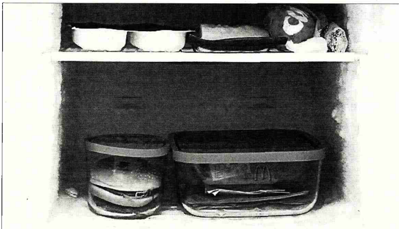
Fotogramas de 'Na distancia' de Víctor Hugo Seoane, arriba, e 'Ejercicios Captales' do dúo Weareqq