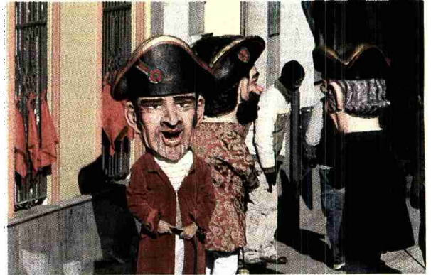
Los tres kilikis, junto a las ventanas sevillanas con pañuelos rojos.

La película que protagoniza Tom Cruise reproduce muchas de las tradiciones de San Fermín, como el encierro, los gigantes o el pañuelo rojo, pero ha sido rodada en Cádiz y Sevilla. La grabación concluirá mañana, y se espera que el estreno tenga lugar en Estados Unidos el 4 de julio del año que viene.