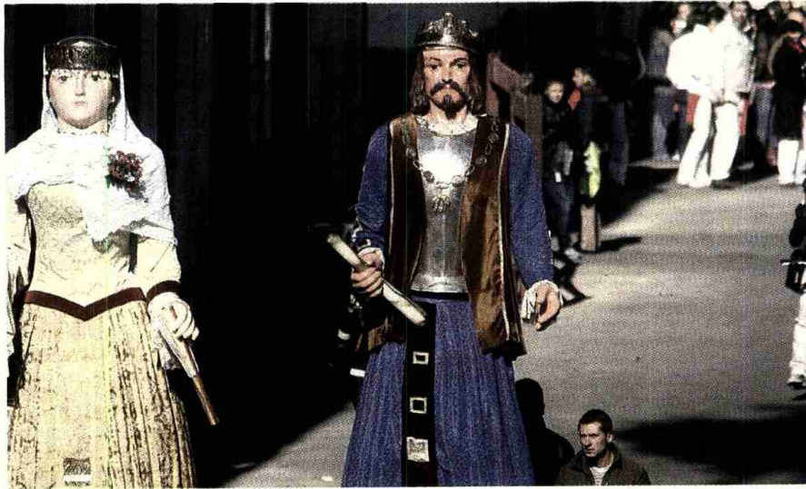
La copia de los gigantes de Europa hecha ex profeso para el filme.