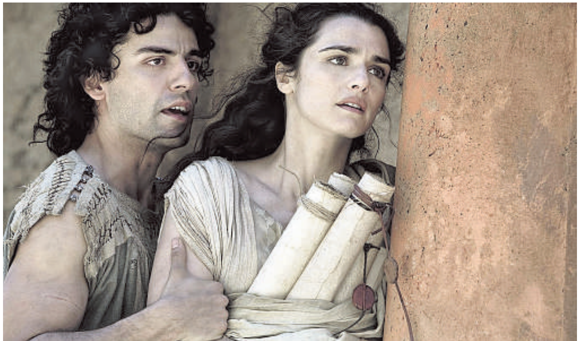
«Ágora», de Alejandro Amenábar, una de las cinco finalistas como mejor película

rias películas españolas entre los diez más taquilleras, dos de ellas disputándose el primer puesto». «El cine español ha roto taquillas», aseguró. «Nuestra producción no es buena, es buenísima. Hay grandes actores, directores y productores. Lo que ocurre es que a veces las cosas se hacen bien y salen y otras veces, no salen. Ahora han florecido. No conozco ningún productor que quiera hacer una película mala o para que la gente no la vea». Sobre el posible parón de las producciones por la suspensión sufrida por la Orden Ministerial en Bruselas, se mostró convencido de que la parada será «intermitente o muy corta; la Ley está muy bien consensuada».