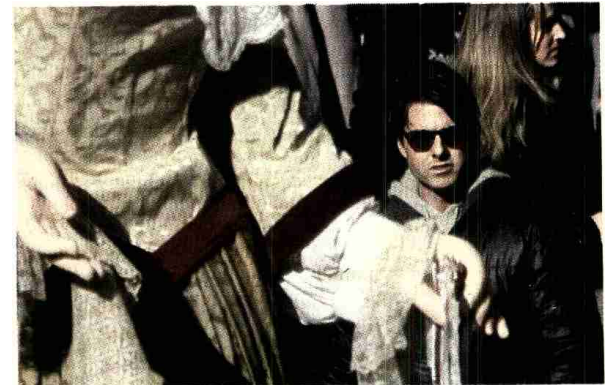
Tom Cruise, el martes durante el rodaje, junto a la gigante de Europa.