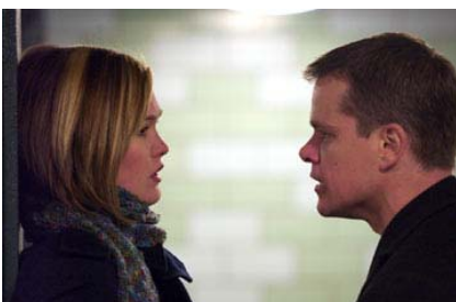
Matt Damon y Julia Styles en The Bourne Supremacy

Thinkfilm introduced "Festival Express" on one screen, grossing $13,000.