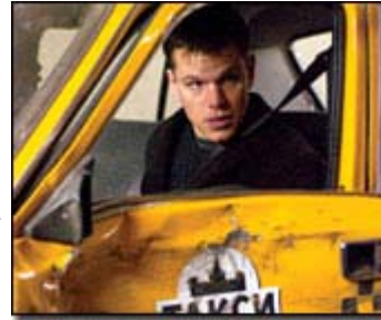
Matt Damon en The Bourne Supremacy

Newmarket reintroduced "Donnie Darko: The Director's Cut" on six screens this past weekend, grossing $54,742 for an average of $9,123. Pic played Seattle last month following the new cut's preem at the Seattle Film Festival. New version has cumed $151,365. Overall, Nielsen EDI estimates total box office for the weekend at $159 million -- nearly identical to the same frame last weekend. It's the third straight week that box office has been flat against last year. Year-to-date box office stands at $5.4 billion, 6% ahead of 2003's $5.1 billion at this point.